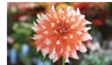
Longueur focale : 30 mm · Exposition : F/2.8 1/20 sec · ISO100

Grâce à sa grande ouverture de F/2.8, cet objectif vous permet d'adoucir l'avant-plan ou l'arrière-plan pour mieux faire ressortir le sujet. De plus, avec une distance minimum de mise au point de 28 cm sur toute la variation, il peut créer des effets macro grands-angulaires.