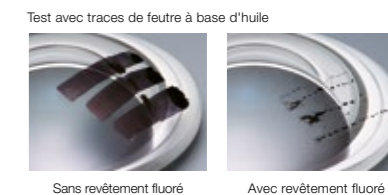
Sans revêtement fluoré · Avec revêtement fluoré

Tamron a développé un revêtement fluoré sur la lentille frontale qui permet d'éliminer facilement les traces de liquides ou de solides (voir schéma). Cette protection innovante permet de compenser l'absence de filtre de protection.