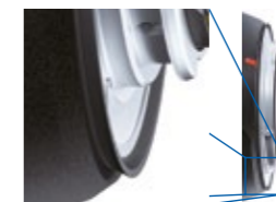
Schéma de la construction tropicalisée

La construction tropicalisée empêche l'humidité de pénétrer dans l'objectif.