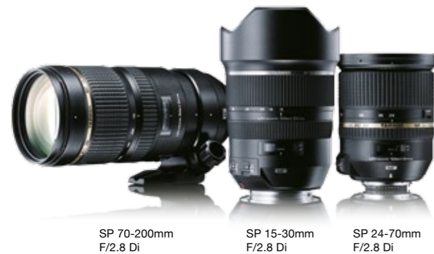
SP 70-200mm F/2.8 Di

**3 La version pour monture Sony n'est pas équipée du système VC puisque les boîtiers reflex numériques Sony possèdent déjà la fonction de stabilisation d'image.