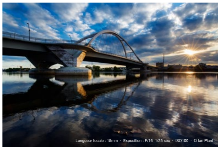
Longueur focale : 15mm · Exposition : F/16 1/25 sec · ISO100 · © Ian Plant