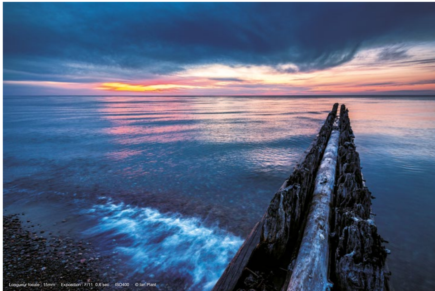
Longueur focale : 15mm · Exposition : F/11 0,6 sec · ISO400 · © Ian Plant