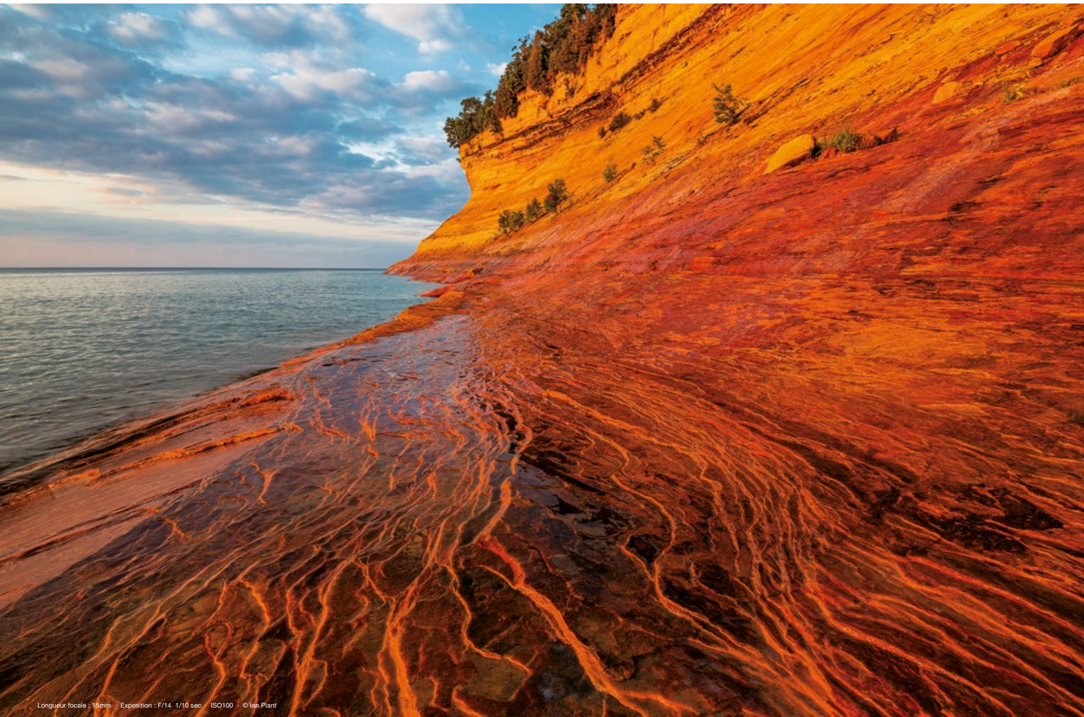
Longueur focale : 15mm · Exposition : F/14 1/10 sec · ISO100 · © Ian Plant