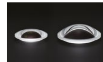
Comparativement à l'ancienne lentille asphérique en verre moulé (à gauche), la lentille XGM a une plus grande surface asphérique.

Une lentille XGM (eXpanded Glass Molded Aspherical) est intégrée au premier groupe d'un système comportant plusieurs lentilles LD (Low Dispersion) dans sa construction optique. Cette combinaison de 18 lentilles réparties en 13 groupes permet de maîtriser efficacement les distorsions et les aberrations chromatiques qui affectent habituellement les objectifs grands-angulaires.