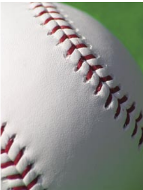
300mm (équivalent d'un 465mm) Exposition : F/9,5 Auto ISO100

MFD: 0,95m (Rapport de grossissement maximal de 1/2)* * Commutation en mode macro.