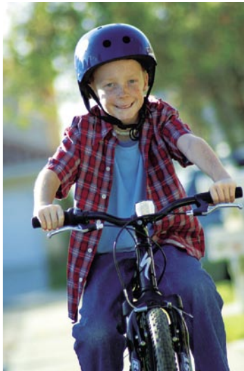
300mm (équivalent d'un 465mm) Exposition : Ouverture maximale Auto ISO400

MFD: 0,95m (Rapport de grossissement maximal de 1/2)* * Commutation en mode macro.