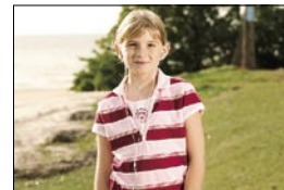
70mm (équivalent d'un 109mm)