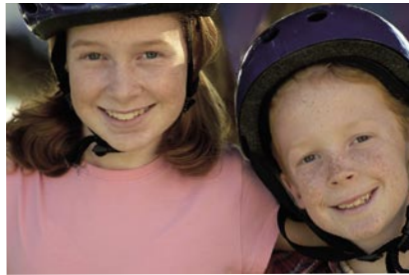
70mm (équivalent d'un 109mm) Exposition : Ouverture maximale Auto ISO400

*Traitements multicouches des surfaces collées d'éléments combinés