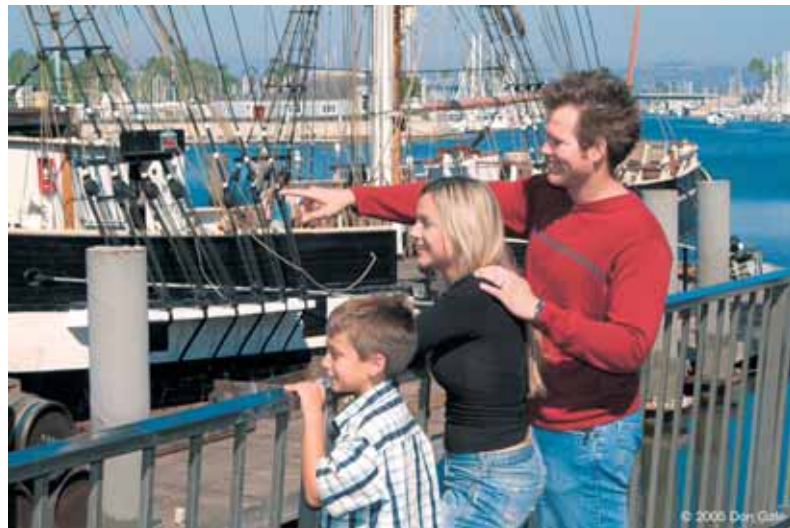
55mm (equivalente a un 85 mm). Exposición: F/16. Auto ISO 100