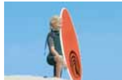
55mm (equivalente a un 85 mm)