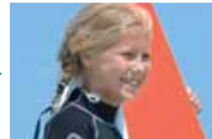
200mm (equivalente a un 310 mm)