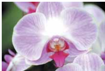
200mm (équivalent d'un 310 mm) Exposition : Ouverture maximale Auto ISO 100 DMMaP : 0,95 m Rapport de grossissement maximal : 1:3,5

*Le RGM de 1:3,5 est équivalent à 1:2,3 en argentique.