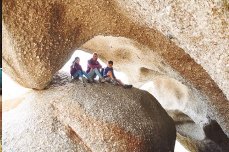
Longueur focale : 18 mm · Exposition : F/3.5 1/40 sec · ISO800