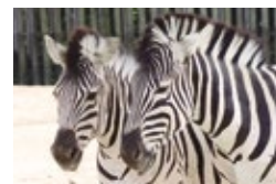
VC : ON

Longueur focale : 200 mm · Exposition : F/11 1/20 sec