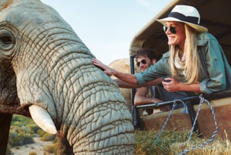
Longueur focale : 18 mm · Exposition : F/5.6 1/125 sec · ISO400 · © Thomas Kettner